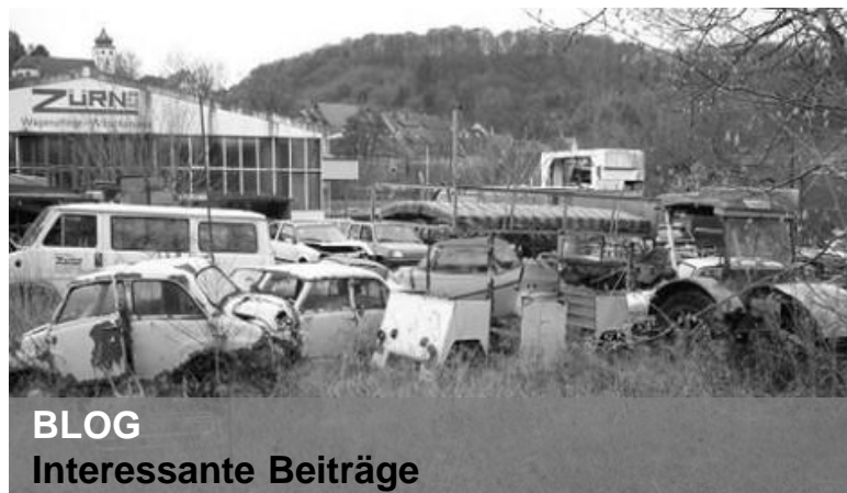
BLOG Interessante Beiträge