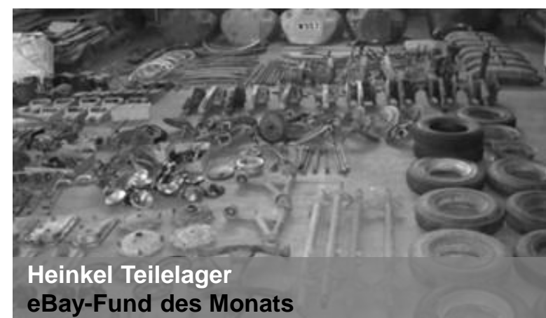
Heinkel Teilelager eBay-Fund des Monats