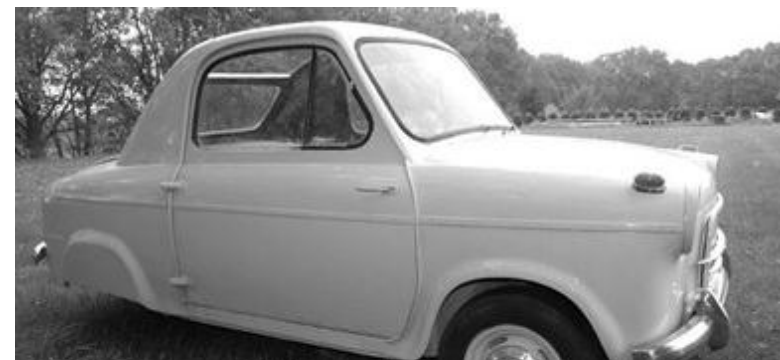
Vespa 400 – Dreirad! eBay-Fund des Monats