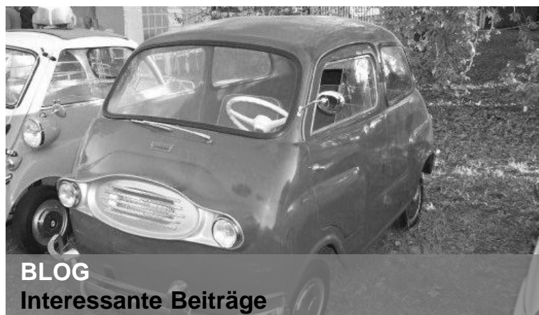
BLOG Interessante Beiträge