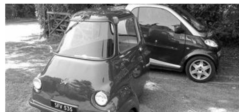
Scootacar MK1 eBay-Fund des Monats