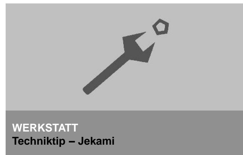
WERKSTATT Techniktip – Jekami